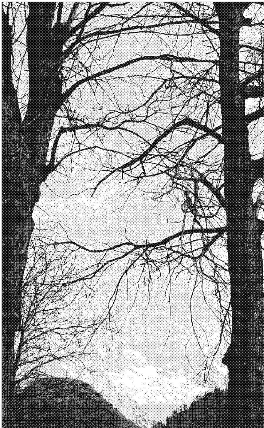
Rauchgetrocknete Kastanien werden zu Schnaps gebrannt. Im Bild der Hain von Castasegna, Bergell.

Ein Schnaps aus Kastanien? Schmeckt der überhaupt? Nun, für unerfahrene Schnaps-Gaumen oszilliert «Castagne» auf der Zunge zwischen Cognac, Grappa und Whisky. Wo er geschmacklich anzusiedeln sei, diese Frage regte die Diskussionen bei der Verkostung im schönen, aber eiskalten Hain von Castasegna an. «Castagne» überrascht durch komplexe Aromen und leichte Süsse; die Rauchnote (Alpenwhisky!) allerdings scheint nur in homöopathischen Dosen vorhanden zu sein. Dafür geht er alkoholisch zur Sache – mit satten 50 Prozent.