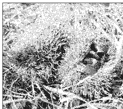
Stachelige Frucht: Edelkastanie.

In Castasegna, der beschaulichen Gemeinde mit der Kastanie im Wappen, werden seit Jahren Anstrengungen unternommen, die schönen Kastanienwälder auch touristisch zu nutzen. Vor einem Jahr wurde ein zwei Kilometer langer Kastanienlehrpfad eröffnet. Er windet sich durch 23 Hektar Kastanienhain, vorbei an uralten Ställen und Trockenmauern. Mehrsprachige Tafeln berichten über die alte Tradition des Kastanienanbaus und der damit verbundenen Kultur. Früher waren Marroni eine Armeleutemahlzeit, und nach dem Zweiten Weltkrieg hatten sie kaum mehr Bedeutung. Erst in den letzten Jahren