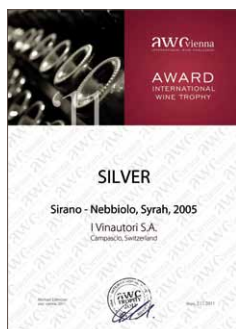
Sirano 2005, Silber 88,3 Punkte