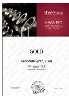
Garibalda 2004, Gold 92,1 Punkte