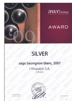
Saga 2007, Silber