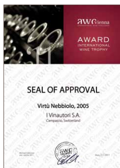
Virtù 2005, Siegel 86,1 Punkte