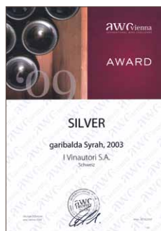
Garibalda 2003, Silber